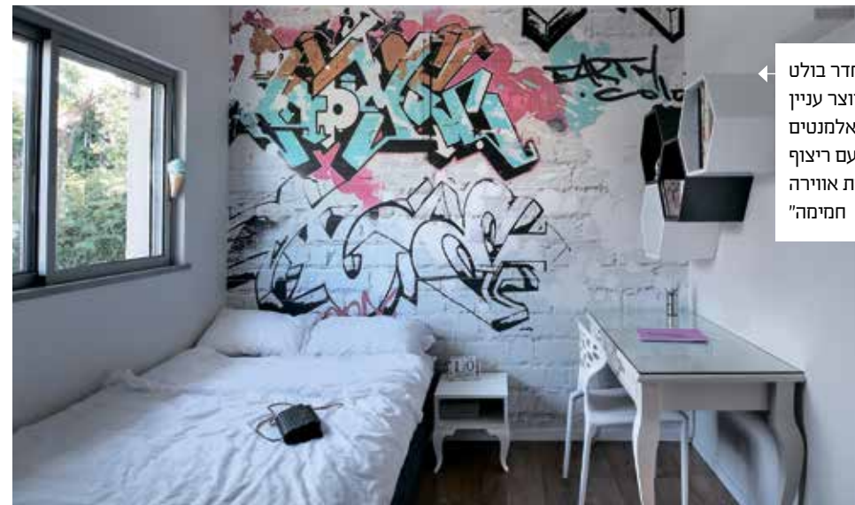
חדר נערה | בחדר בולט טפט גרפיטי שיוצר עניין סביבו שולבו אלמנטים מאוד נקיים, עם ריצוף פרקט להשלמת אווירה חמימה