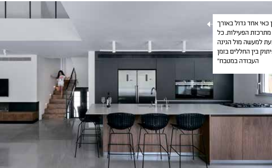
המטבח | תוכנן כאי אחד גדול באורך 4.5 מטר ובו מתרכזת הפעילות. כל העבודה מתבצעת למעשה מול הגינה והסלון, ללא ניתוק בין החללים בזמן העבודה במטבח