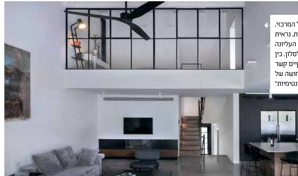
הבית | מהחלל המרכזי, שהוא לב הבית, נראית הקומה העליונה המשקיפה לסלון. בין כל המפלסים קיים קשר עין, שיוצר תחושה של אינטימיות