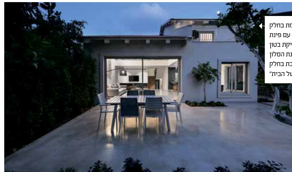
הגינה | ממקומת בחלק האחורי של הבית עם פינת ישיבה על יציקת בטון מוחלק, כשוטרינית הסלון העצומה משתלבת בחלק החיצוני של הבית