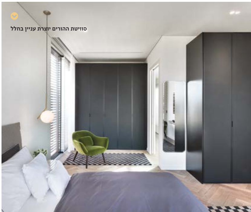
סוויטת ההורים יוצרת עניין בחלל