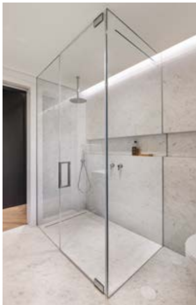
חדר הרחצה של ההורים מאוד נקי ומינימליסטי בעיצובו. יש בו פלטות שיש וגידים לבנים ואפורים, כאשר כל הקירות חופו בשיש